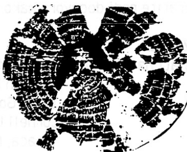
Uzorak s Demircihüyüka s 12 godina (beznadno za datiranje)