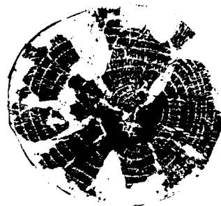
Mostră de la Demircihöyük cu 12 inele (datare imposibilă)